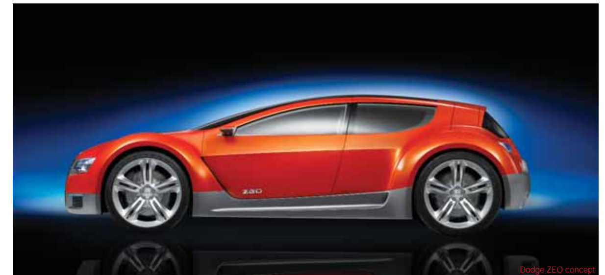
Dodge ZEO concept

Heritage and future A Dodge car should be immediately recognisable as a Dodge, identifiable as it is known and loved. This is the future guideline of the American brand and within, the concept car Dodge Zeo, is the benchmark of a new generation of 'muscle cars' of the 21st century. Dodge Zeo (Zero Emission Operation) is a concept coupe equipped with an electric motor, which expresses the sports performance and characteristic exuberance of the American brand in an eco-compatible way. This concept proves the ability to dare, allowing to create something as innovative and unusual as the connection between emotion and ecology, design and environment. It is a concept car which has the audacity, like a true Dodge, to challenge hybrids and sports cars without connection to any specific category, proud of its uniqueness.