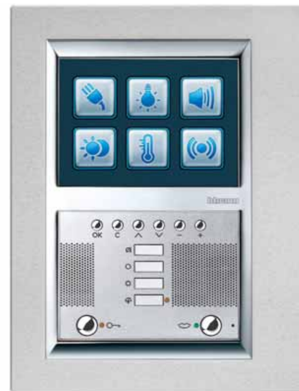
Axolute video station, Alluminio

In 2005 Bticino presented Axolute, the latest stage in their design and innovation evolution: a new civil line to suit modern lifestyles which unites technology and aesthetics in an exclusive and updated system which surpasses previous industrial limits. Accessible and customisable luxury, the Axolute control panel is available in 41 styles, with a range of unusual materials including Carrara marble, leather, Corian®, slate and vintage woods, along with, of course, aluminium, inoxidised steel and glass. The Axolute line won the Intel Design Prize in 2005, was included in the ADI Design Index 2006 and was awarded the LiviLuce Prize for Innovation and Design in the Design category in 2006.