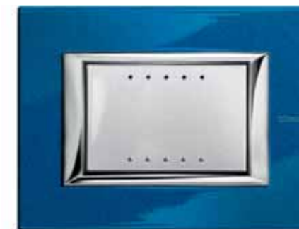
Axolute soft touch chiaro, laccato Blu Meissen

The 1955 Domino series evidenced this spirit: made from an ivory coloured heat-resistant resin, it was characterised by the minimalist style of the border.