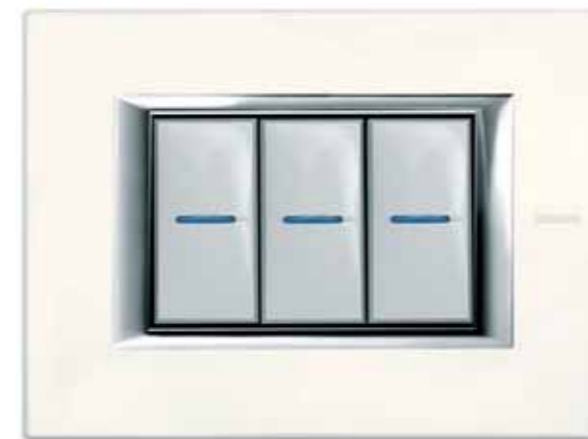
Axolute comando assiale chiaro, laccato bianco Limoges

Developed in Varese in the years after the Second World War, in a climate of fervent expansion in industrial production, Bticino has always had innovation at the heart of its development.