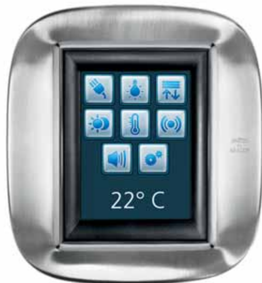
Axolute touch screen, Acciaio Alessi inox spazzolato

Nel 2005 BTicino presenta Axolute, ultima tappa dell'evoluzione del design e dell'innovazione BTicino: una nuova linea civile per ambienti dallo stile di vita contemporaneo che unisce estetica e tecnologia in un sistema evoluto ed esclusivo che supera i tradizionali limiti industriali. Lusso accessibile e personalizzabile, il comando Axolute è disponibile in 41 finiture, con una gamma materica ampia e inusuale che comprende anche il marmo di Carrara, la pelle, il Corian®, l'ardesia e legni pregiati, oltre naturalmente all'alluminio, all'acciaio inox, al vetro, al tecnopolimero. La linea Axolute ha ottenuto il Premio Intel Design nel 2005, è stata selezionata all'interno dell'ADI Design Index 2006 e si è aggiudicata il Premio Innovation & Design Award per la categoria Design - LiviLuce 2006.