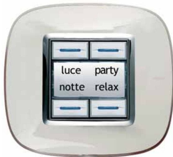
Axolute scenary touch chiaro, liquido bianco

In 1961 the Magic range was born, a revolutionary unit. It was the first civil modular series: modern, simple and made out of stainless aluminium, representing the aesthetical research of the 1960s. In the following years, the attention given to security issues brought about Salvavita, the innovation and invention of Bticino, which soon became a household name. In 1985 the Living series was introduced, which could be used in a number of different environments. The innovative conceptual and design value of the product helped Living to win the Compasso d'Oro prize for design in 1989. In 1996 Living International and Light was created, two new lines which had the same defined roles not only as functional and decorative products but also communicational and above all relating to peoples' 'lifestyles'. The beginning of 2000 saw the design of Light Tech, which offers a natural interface for the first integrated and automated home entry system: from comfort to energy saving, from communication to security. In 2001 Bticino, starting from the developments made in electrical plant in the 1990s, launched the My Home automated entry system, which has all the functions related to comfort, security, saving, communication and control.